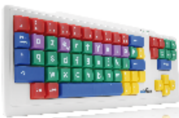
Clavier enfant Bluestork